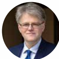
オーレリウス・ジーカス [駐日リトアニア共和国特命全権大使]