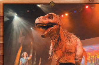
大人気肉食恐竜の ティラノサウルス