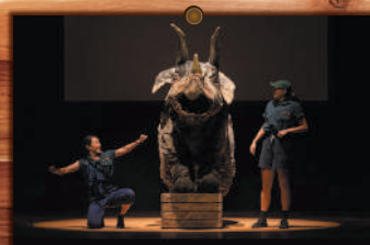
トリケラトプスと コミュニケーション